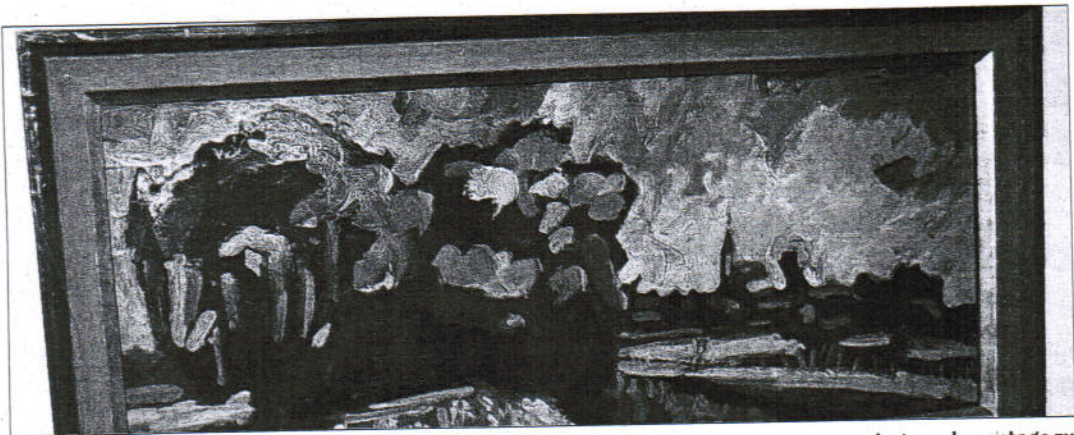
Landschaften aus dem Nachlass Theodor Zellers sind bis zum 4. Februar donnerstags, samstags und sonntags zu sehen.

Im „Storchenturm“ wird zur besagten Öffnungszeiten immer auch jemand anwesend sein, um einige Erläuterungen zu geben, wenn man das möchte.