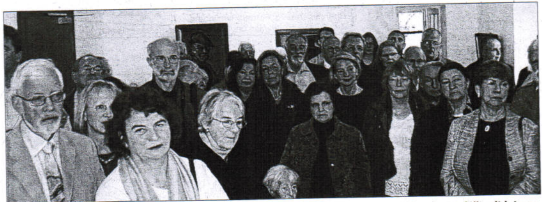
Alle Räume der Galerie im Alten Rathaus waren bei der Vernissage am vergangenen Sonntag gefüllt mit interessierten Besuchern.